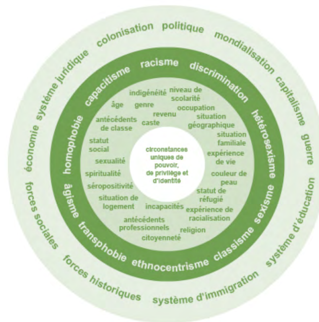
L'intersectionnalité illustrée par un diagramme [image numérique]. Women Friendly Cities Challenge. https://womenfriendlycitieschallenge.org/intersectionality/ (Adapté de l'Institut canadien de recherches sur les femmes, 2009). En attente : réimprimé avec permission.

Un cadre élaboré par Kimberlé Crenshaw (1989) qui décrit comment chaque personne a de multiples identités sociales qui sont connectées dans des contextes plus vastes pour créer des privilèges ou des désavantages. L'Institut canadien de recherches sur les femmes a créé un outil visuel qui illustre l'intersectionnalité. Dans ce diagramme, « le cercle le plus au centre représente les circonstances uniques d'une personne, le second cercle montre les aspects d'une identité individuelle et le troisième cercle montre différents types de discrimination et d'attitudes qui affectent l'identité; le cercle externe montre les forces et structures plus grandes qui renforcent l'exclusion » (Women Friendly Cities Challenge, s.d.).